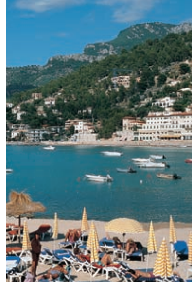
Haven van Sóller

Het is mogelijk naar Port de Sóller te reizen met een traditionele tram, een zeer aanbevelenswaardige excursie. Vanuit Port de Sóller vertrekken er schepen naar sa Calobra , een strand dat een waar natuurspektakel vormt. De terugreis naar Palma kan via de tunnel van Sóller die Palma met Sóller verbindt (carretera C-711).