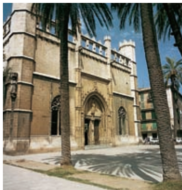
La Llotja. Palma

Vervolgens komt U bij La Rambla aan, een levendige boulevard met talrijke bloemenstalletjes. Aan het einde ligt de Botanische Tuin met de ficus nitida , de grootste boom van Palma. U loopt nu bergafwaarts via de Calle de San Jaume naar de Avenida de Jaime III , met zijn bogen en winkels en als U de avenue oversteekt komt U via een paar kleine straatjes bij het pleintje van La Llotja.