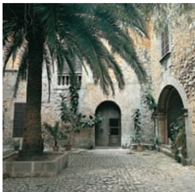
Karakteristieke binnenplaats. Santanyí

gebruikt als woning en observatieposten in de vestingwerken van de eilanden.