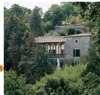
La Granja. Esporles

Op de terugweg naar Palma is het aan te bevelen een bezoek te brengen aan La Granja , dichtbij Esporles. La Granja is een prachtig groot huis waar een buitengewoon interessant Volkenkundig Museum is gevestigd waar landbouwwerktuigen, gereedschap en voorwerpen van allerlei oude ambachten tentoongesteld zijn. Ook bevindt zich hier een uitgebreid aantal meubels en huishoudelijke gebruiksvoorwerpen. De bezoeker wordt hier vergast op warme beignets, wijn en delicatessen uit de volksgastronomie van Majorca.