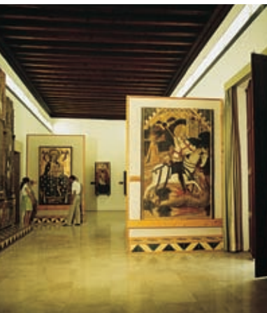
Museum van Majorca. Palma

In de Calle de Portella staat het Museum van Majorca (8). Dit is een oud paleis van Majorca (uit 1634) waar archeologische resten uit de prehistorische, Romeinse, Mohammedaanse en middeleeuwse tijd bewaard worden. Ook worden er schilderijen- en beeldtentoonstellingen gehouden. En in de Calle de Serra bevinden zich de Arabische baden, een voorbeeld van de Arabische kunst in Majorca.