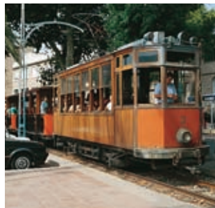
Trein van Sóller

een bezoek te brengen aan het natuurwetenschapsmuseum Museo Balear de Ciencias Naturales (op de weg naar Port de Sóller).