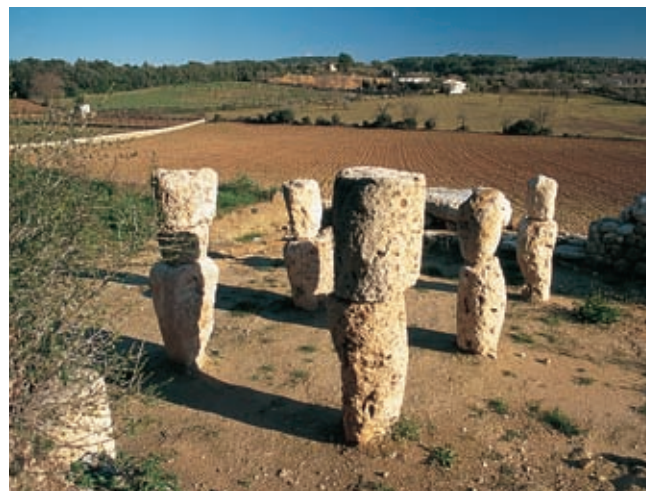
Son Corró. Costitx

Het Museum van de Fauna van de Balearen is zeker een bezoek waard, met een grote verscheidenheid aan opgezette dieren.