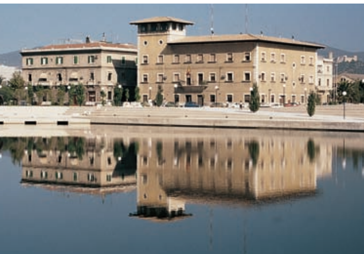
Parc de la Mar. Palma

Romeinen. Indertijd noemden de Romeinen de stad al Palma. Vanaf 903 n.C. veranderden de Arabieren de naam in Madina't Mayurga . En na de herovering in 1229 gaven de Catalanen de stad de naam Ciutat de Mallorcaes . Tegenwoordig zegt men Palma of Ciutat .