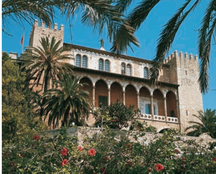
La Almudaina. Palma