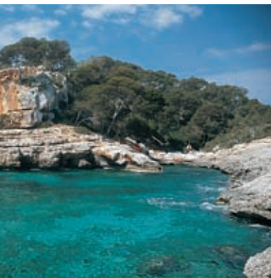
Cala s'Almunia. Santanyí

Alvorens Santanyí binnen te rijden ziet men het talaiot van Son Danús, een soort torentje dat een arrogante en majestueuze indruk maakt. Het stamt uit de bronstijd toen de zogenaamde talaiotcultuur ontstond. Deze megalitische monumenten verkregen hun naam van het Arabische woord atalaia , dat uitkijktoren betekent. De talaiots werden gebouwd in ronde of vierkante vorm en werden