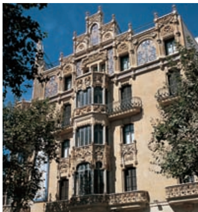
Modernistisch gebouw. Palma

voor het afsluiten van de kleine middeleeuwse haven met kettingen.