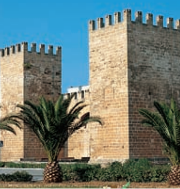
Poort van Sant Sebastià. Alcúdia

De leerindustrie is hier belangrijk. Ook de kerk van Santa María la Mayor is de moeite waard. Hier kan men heerlijk eten in de "cellers" (bodega-restaurant), gespecialiseerd in de streekgastronomie. De koekjes van Inca, licht gezouten en goed doorbakken, zijn een geliefde lekkernij.