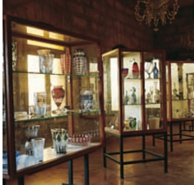
Glasmuseum. Algaida. Can Gordiola

De route (C-715) loopt door de oude boomgaarden van de stad, waar het vee graast en waar de karakteristieke molens staan die het terrein een geheel eigen aanzien geven. Het vliegveld van Son Sant Joan, aan de