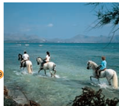
Paardrijden. Baai van Pollença

Teatro Principal. Classicistische gevel met Dorische, Ionische en Corinthische zuilen. Het theater werd 350 jaar geleden opgericht,