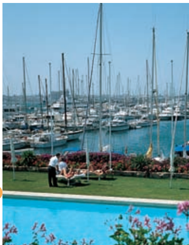
Koninklijke Jachtclub. Palma

Real Club Náutico de Palma: met openluchtzwembad, bars en restaurant; Muelle San Pedro nr. 1 (Palma). Club de Mar: Muelle de Pelaires (Palma). Puerto Portals: met 670 ligplaatsen en zeilschool; Portals Nous. Club Náutico de Santa Ponça: met 522 ligplaatsen en zeilschool.