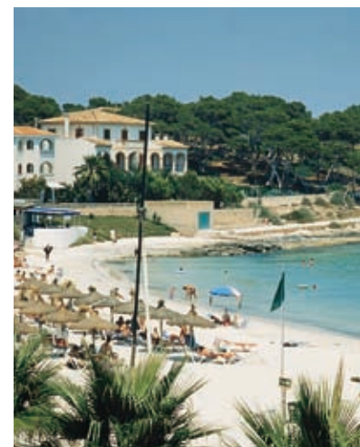
Strand. Colònia de Sant Jordi

U gaat nu weer terug naar de weg die vlak langs de kust loopt en bereikt tenslotte s'Arenal en Can Pastilla, kosmopolitische toeristencentra met een prachtig strand, het Playa de Palma .