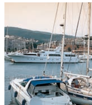
Haven. Portals Nous

De route begint op de Paseo Marítimo in de richting van de zonsondergang. Men neemt de snelweg (A-1) en bereikt spoedig Palmanova, dat tegen Magaluf aan ligt, een toeristisch centrum in de gemeente Calvià, met prachtige stranden en prima hotels. Dichtbij bevinden zich Portals Nous en Puerto Portals, met hun elegante terrassen tegenover de