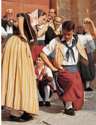
Traditionele dansen. Selva

Er zijn nog vele andere niet-religieuze vrolijke feesten gevierd die verband houden met de oogst en voedsel. Het Festa des Melo te Vilafranca op de tweede zondag van september. En het Festa des Vermar (druivenoogstfeest) wordt op de laatste zondag van september gevierd in Binissalem, dat op Majorca als de hoofdstad van de wijn beschouwd wordt. Het Festa des Botifarro , in San Joan, op de eerste zondag van oktober en het Festa des Bunyol op de laatste zondag van oktober te Bunyola.