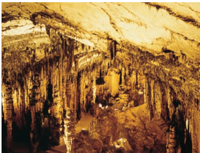
Grot van Artà