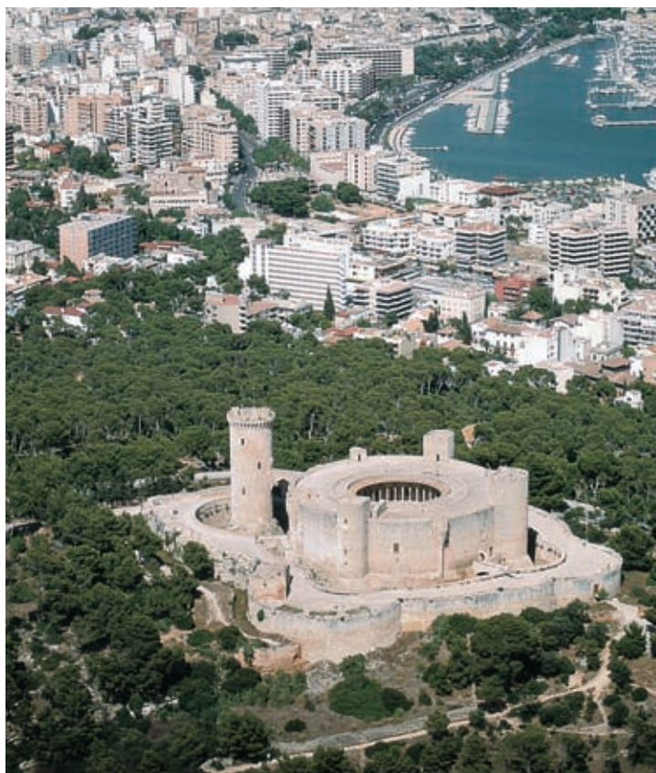
Kasteel van Bellver. Palma

Naast paleizen, kerken en monumenten bezit Palma ook prachtige parken. De bomen, planten en groenzones zijn ware stadslongen. Het zijn plekken waar men nog even rustig alleen kan zijn en de zonnige middagen kan doorbrengen, en waar men kan deelnemen aan het kenmerkende leven van een aan de Middellandse Zee gelegen hoofdstad.