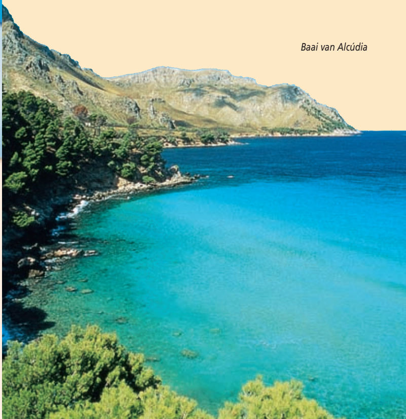
Baai van Alcúdia

Voorpagina: Uitzicht bij nacht op de kathedraal van Palma. Majorca