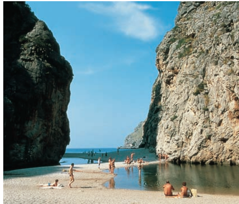
Torrent de Pareis. Sa Calobra