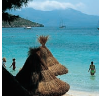
Strand van Formentor

La Bahía de Pollença is de kleinste en fraaiste baai van Majorca, een doorzichtig blauw medaillon tussen de kapen Pinar en Formentor. Vervolgens bereikt men de Port de Pollença , bezongen door dichters en vereeuwigd door schilders. Het is één van de eerste toeristische plaatsen van Majorca, met een uitstekend serviceniveau en heel goed van kwaliteit. Van hieruit vertrekken er boten naar Formentor, gelegen op een afstand van een half uur varen. Deze laatste plaats kan ook over land bereikt worden, via een gewaagd aangelegde weg door de bergen. Hier komt men langs het uitkijkpunt van Colomer, een verticale rots van 232 meter hoogte.