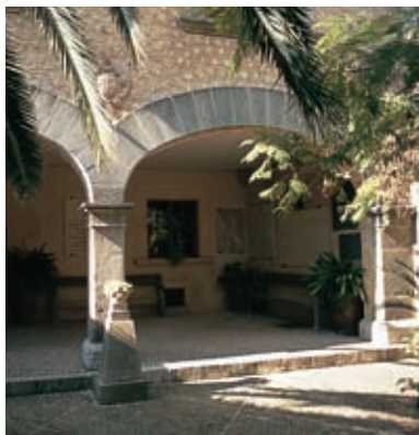
Geboortehuis van Fray Junípero. Petra

Sineu is de grootste plaats op deze route. Het ligt in het geografische middelpunt van Majorca en in Sineu beschikten de middeleeuwse koningen over een paleis, tegenwoordig een klooster. De kerk is prachtig en in het stadje zijn er uitstekende cellers (bodega-restaurant) te vinden waar goede streekgerechten geboden worden. Het is aan te bevelen vooral de frito mallorquin eens te proeven.