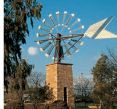
Karakteristieke molen. Son Sant Joan

Manacor, met 30.000 inwoners, is de streekhoofdstad en een industriële plaats: meubels en parels. Het is aan te bevelen een bezoek te brengen aan de internationaal befaamde Majorcaparelfabriek. In Manacor is het ook de moeite waard de Aarts priesterkerk te bezoeken, evenals het Klooster van Santo Domingo en het Streekmuseum.