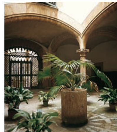
Karakteristieke binnenplaats. Palma

La Llotja (9), de oude beurs en warenruilhuis is een aanzienlijk gebouw, dat een hoogtepunt vormt van de gotische mediterrane stijl (xve eeuw) met een elegante en prachtige gevel. Binnen in het gebouw lijken de zes spiraalvormige zuilen die het gewelf ondersteunen op een stenen palmbomenbos. Naast de Llotja staat het Consulado del Mar, waar tegenwoordig de Regering van de Gemeenschap gevestigd is. Het Consulaat van de Zee (xviiie eeuw) was een tribunaal dat maritieme rechtszaken beslechtte die met het verkeer en de handel te maken hadden. Het gebouw heeft een naar de zee gerichte galerij met een fraai vakwerkplafond.