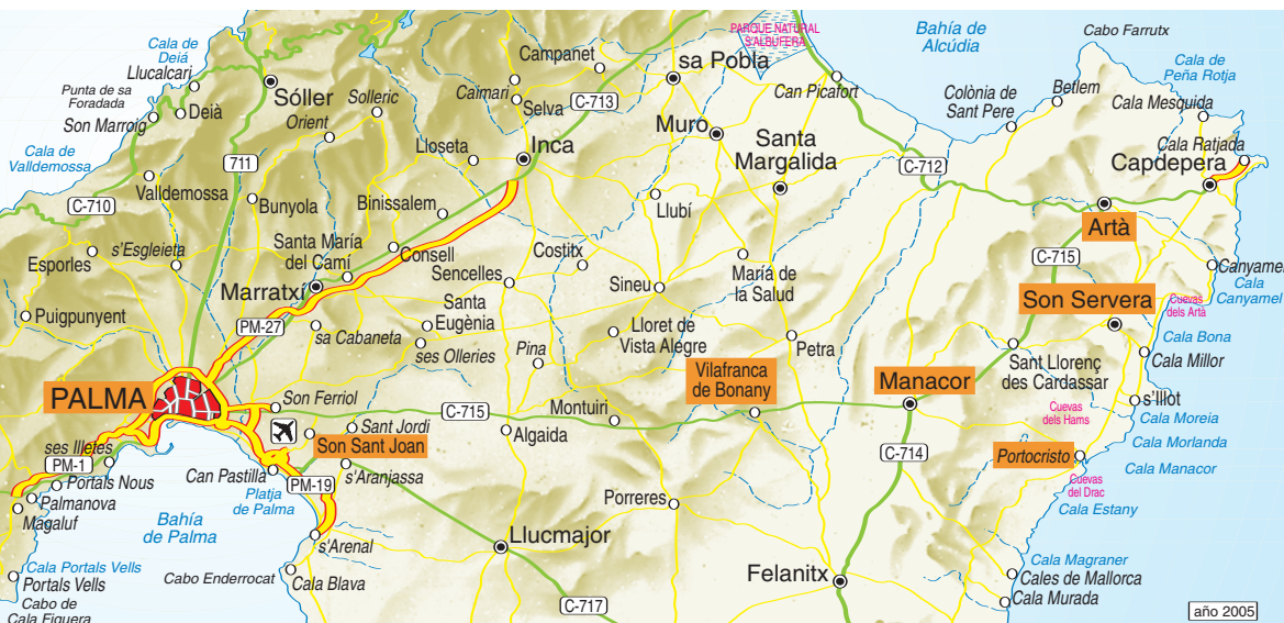
Zuilengang klooster van San Vicente Ferrer. Manacor

Aan de andere kant van het water verschuilen zich de beroemdste grotten, die van de Drac. Een fantasiewereld met duizenden stalactieten en stalagmieten. De naam (El Drach) verwijst naar de draak die naar zeggen de ingang bewaakte.