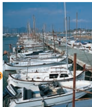
Haven van Pollença

El Port d'Alcúdia . Dit is een toeristisch centrum met winkels en een vissershaven. Alcúdia telt samen met de haven gewoonlijk tienduizend inwoners, maar bereikt in de zomer de honderdduizend inwoners. Deze toeloop in de zomer is te danken aan het mooie strand en de uitstekende hotelvoorzieningen.