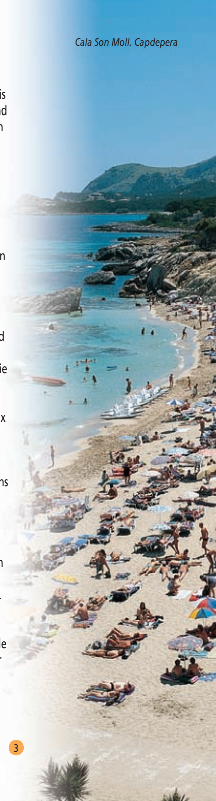
Cala Son Moll. Capdepera

Majorca telt 615.000 inwoners en de helft daarvan woont in de hoofdstad, Palma. Het karakter van de mensen van Majorca is serieus en afstandelijk, maar zeer beleefd en gastvrij.