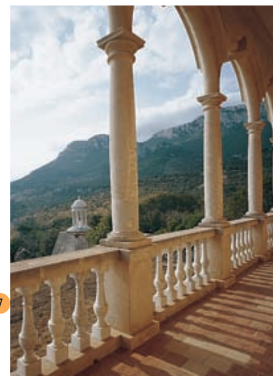
Son Marroig. Valldemossa

Het is één van de fraaiste uitzichten van de kust van Majorca. Hier bevindt zich Na Foradada, de door wind en golven doorboorde rots. Alvorens de route te vervolgen is het aan te bevelen een bezoek te brengen aan het Woonhuis-Museum van Aartshertog Lodewijk Salvador van Oostenrijk.