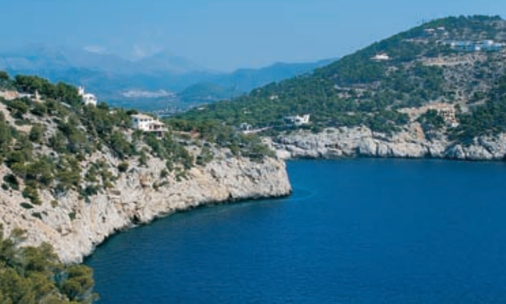
Kaap van sa Mola. Andratx