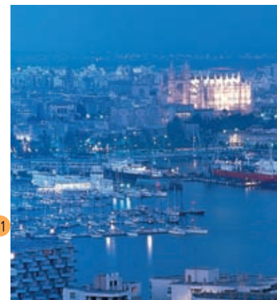
Palma bij nacht

met hun gezellige straatjes en bars waar spontaan muziek gemaakt wordt trekken vele jongeren aan. De Paseo Marítimo is ook een zone met discotheken en uitgaansgelegenheden. Er zijn elegante en populaire discotheken voor alle leeftijden. Sommige beschikken over een terras en verscheidene zalen en verschillende stijlen moderne muziek. Het plaza Gomila is een gebied voor jongeren met talrijke discotheekbars. S'Arenal is eveneens een zone met populaire discotheken en nachtelijke uitgaansgelegenheden. Buiten Palma, in Magaluf, staat de grootste discotheek van Europa en een luxueus casino met eetgelegenheden en voorstellingen. De verscheidenheid aan nachtelijke uitgaansgelegenheden op het eiland is te groot om op te noemen. En alvorens van uw nachtrust te gaan genieten kunt U nog even vanaf een terras het nachtelijke kleurrijke uitzicht op de baai van Palma bewonderen.