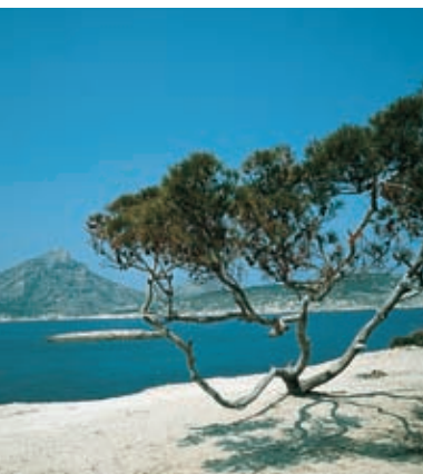
Strand van Sant Elm

Via de weg (C-719) die in het verlengde van de snelweg ligt, bereikt U Santa Ponça , van waaruit het christendom verbreid werd door koning Jaime I, hetgeen elk jaar op 9 september herdacht wordt. Santa Ponça is tegenwoordig een toeristische en residentiële plaats met een strand gelegen tussen dennenbomen, restaurants en een jachthaven. In deze gemeente Calvià zijn er uitgestrekte en goed onderhouden golfbanen te vinden.